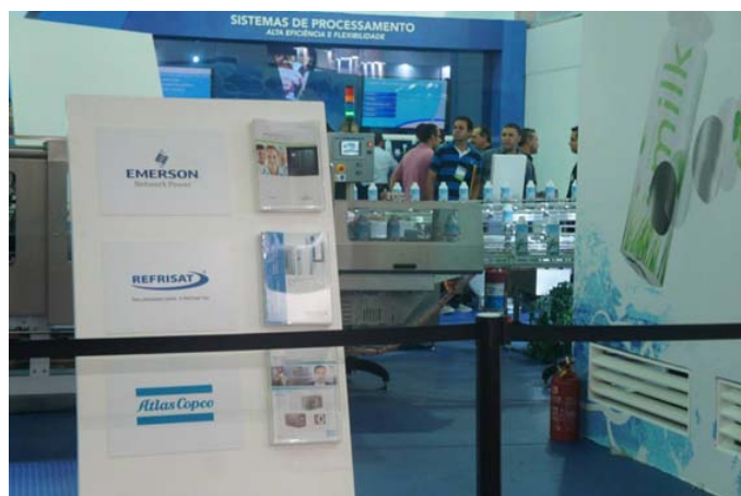
A REFRISAT no Stand da Tetra Pak da FISPAL Tecnologia 2013

Uma das máquinas no modelo SAT Ar Touch com capacidade para 45.000 kCal fez parte do processo de demonstração de produção de algumas embalagens Tetra Pak, em um espaço muito bem organizado e distribuído, onde foi possível enxergar de maneira indireta como a REFRISAT também faz parte da produção destes produtos.