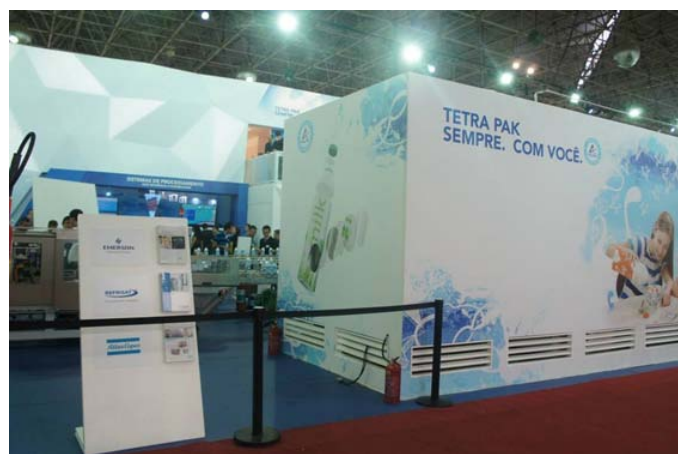
A SAT 45 AR Touch estava nesta grande estrutura retangular, ajudando no processo de produção de embalagens demonstrado no interior do stand da Tetra Pak.