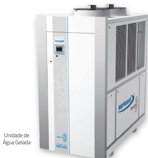
Unidade de Água Gelada